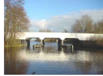
De brug over het Stobberak

Je vaart nu op de Hoarse en via de Jurjensleat en de Langstaarterpoel (Langsturtepoel) wordt de Gudsekop (Gudzekop) bereikt. In dit gebied bevinden zich veel aanlegplekken van de Marrekrite. Vanaf de Gudsekop vaar je recht uit de Goïngarijster Poelen (Goaiingarypster Puollen) op. Ongeveer 1200 meter verder aan stuurboordszijde is een jachthaven (Oer 't String) zichtbaar. Deze haven ligt vlak achter een klein sluisje (breedte 4,50 meter), waarna men in de Lijkvaart (Lykefaert) uitkomt. Na de brug (doorvaarthoogte 2,50 m., zeer smalle en bochtige passage) een kilometer verder bakboord uit de Zijlsloot (Syltjesleat) in. Na een haakse bocht vaar je langs Akmarijp (Akmaryp) Met aan het einde van het dorp weer een brug. Na de brug volgt een haakse bocht naar bakboord, een halve kilometer verder draait men ongeveer 90° naar stuurboord uit en komt in de Lange Sloot.