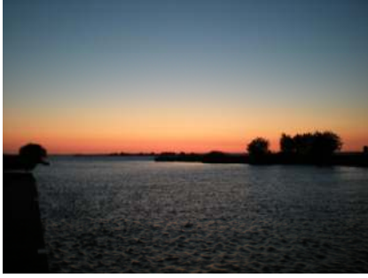
Avond aan het Tjeukemeer