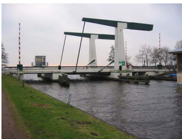
De brug bij Osingahuizen

Na de Sudergoabrêge kan men er ook voor kiezen om bakboord uit te gaan bij de woonschepen en naar Bolsward (Boalsert) te varen via de Workumer Trekvaart. Na het Kruiswaters komt men dan, als men stuurboord aanhoudt, in de Wymerts langs Abbegaasterketting en Vijfhuizen. Na Oosthem (draaibrug met zelfbediening buiten het hoogseizoen) kom je uit bij de spoorbrug en de brug nabij IJlst (Drylts), waar je stuurboord aanhoudt, de Wijde Wymerts op naar Osingahuizen.